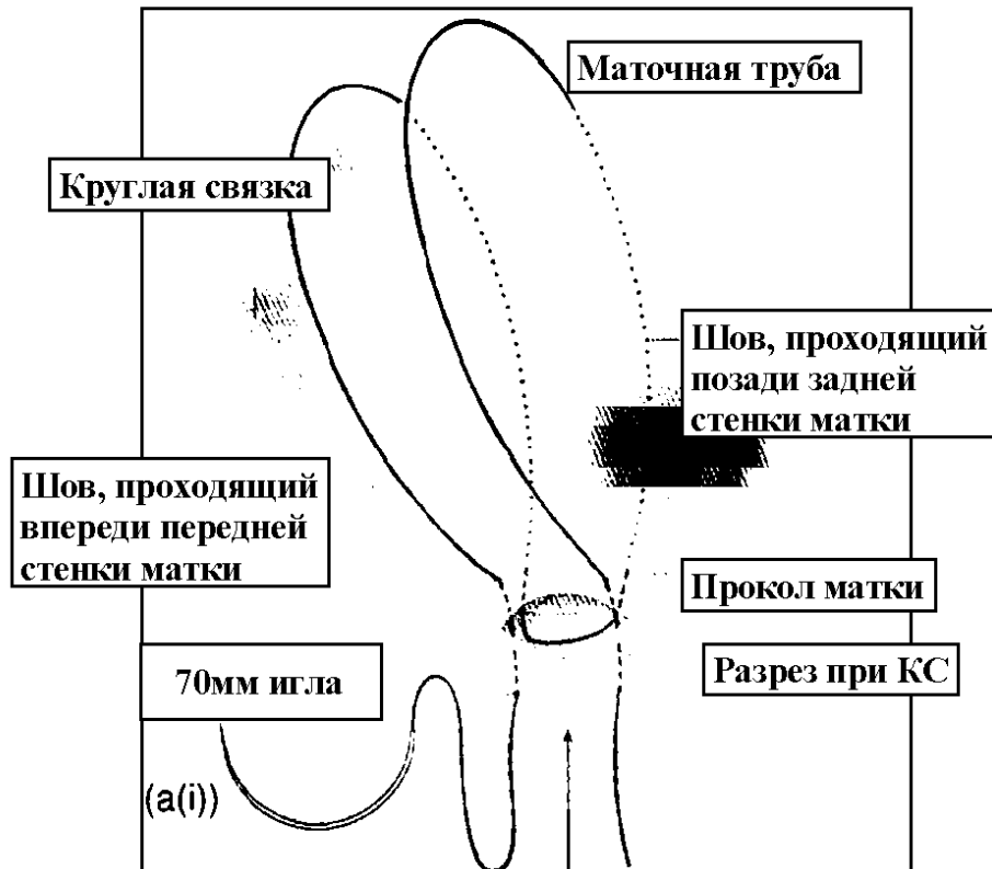
Рис. 1. Техника наложение компрессионного шва по В-Лynch